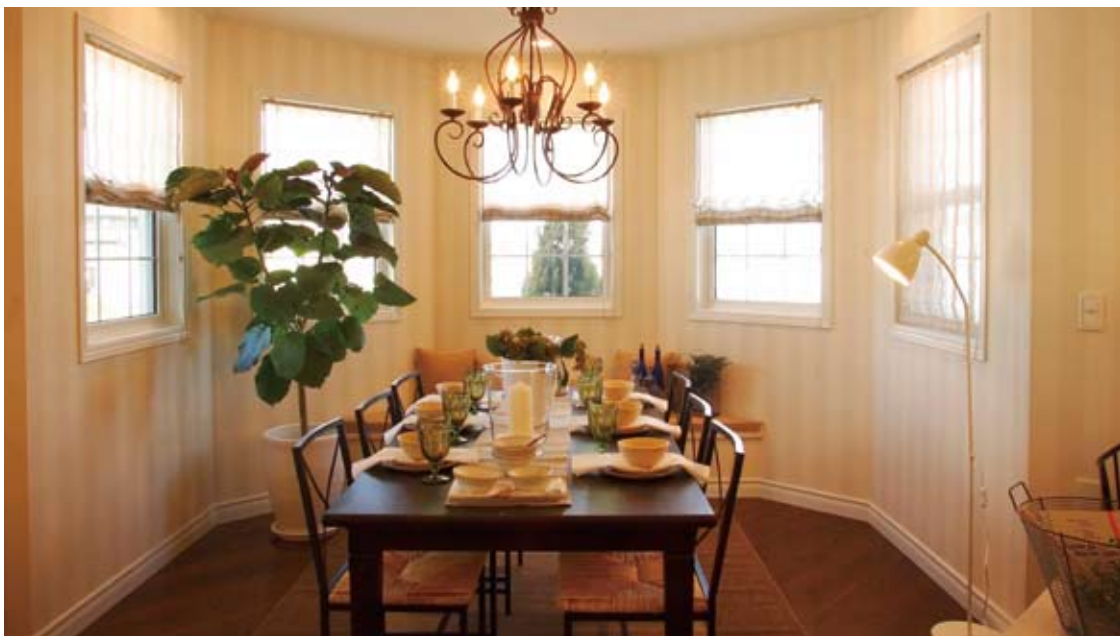
アールを描くウォールに沿って、たくさんの縦長窓をデザインしたダイニング。オフホワイトのボーダー柄で仕上げたウォールクロス、フローリングとテーブルの重厚なブラウンの組み合わせで、落ち着いた心地良い空間をつくりだしている。アンティーク調の照明もおしゃれ(施工例)