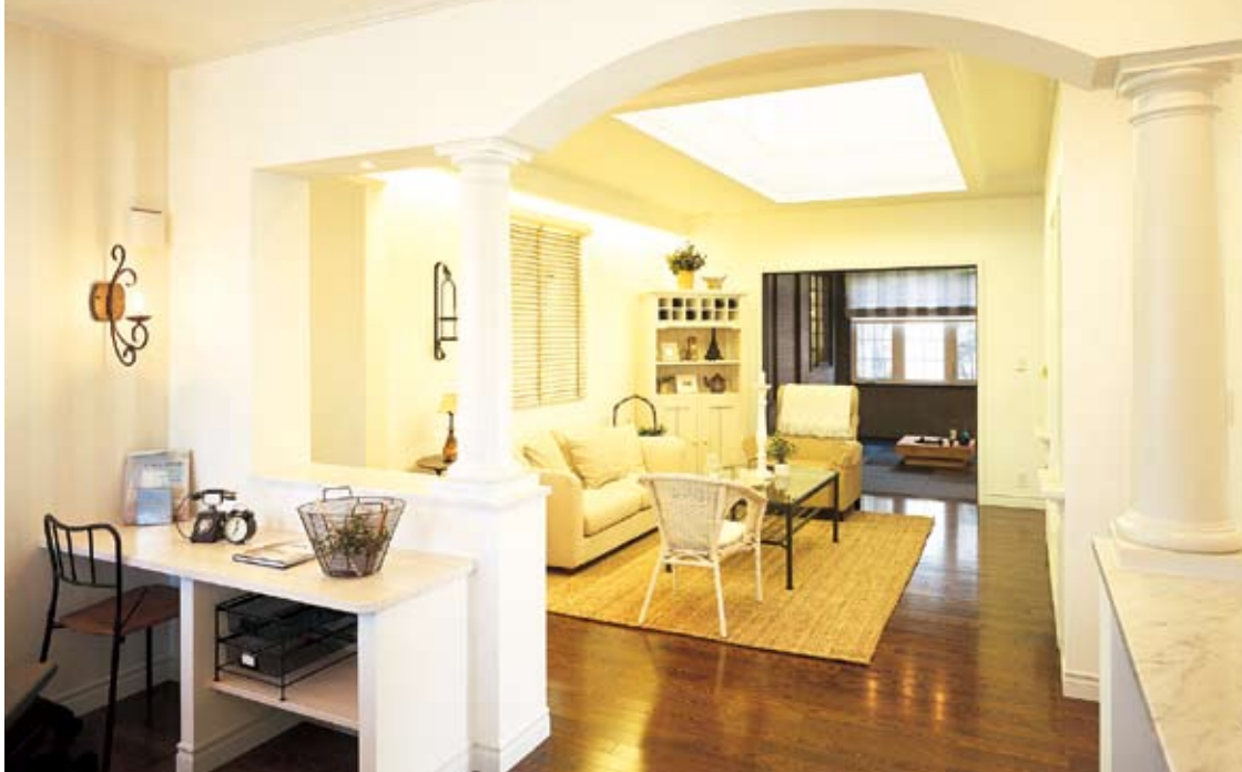
上部にデザインしたアールの下がり壁と、両サイドに据えた白いコラムが空間にほど良い距離感を醸し出しているくつろぎ空間。いつも家族の気配が感じられるように、リビング側に家事スペースを設計。ホワイトのカウンターがさわやかで、すがすがしい印象を与えている。(施工例)