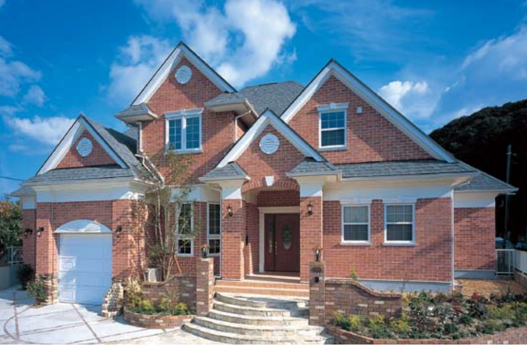
切妻が幾重にも重なり合うシャープな屋根形状に伝統的な要素を巧みに表現した外観。外壁はレンガ仕上げ、白いボードの塗り壁とペディメント部分の白いラウンドルーバーがエレガントなアクセントになっている（施工例）