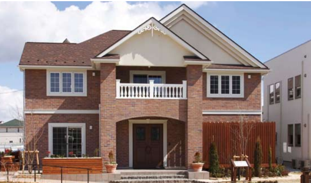
レンガの外壁と軒下の塗り壁や装飾部材、バルコニーの白さが美しく映えるたたずまい。木製のフェンスを施すことで外観の重厚さにナチュラル感のあるやわらかさを加えている。アプローチのアールもアクセントに（施工例）