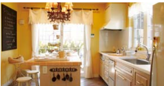
1型キッチンとアイランドカウンターを合わせて設置し、キッチンワークがスムーズに行えるよう、空間をゆとり確保している(施工例)