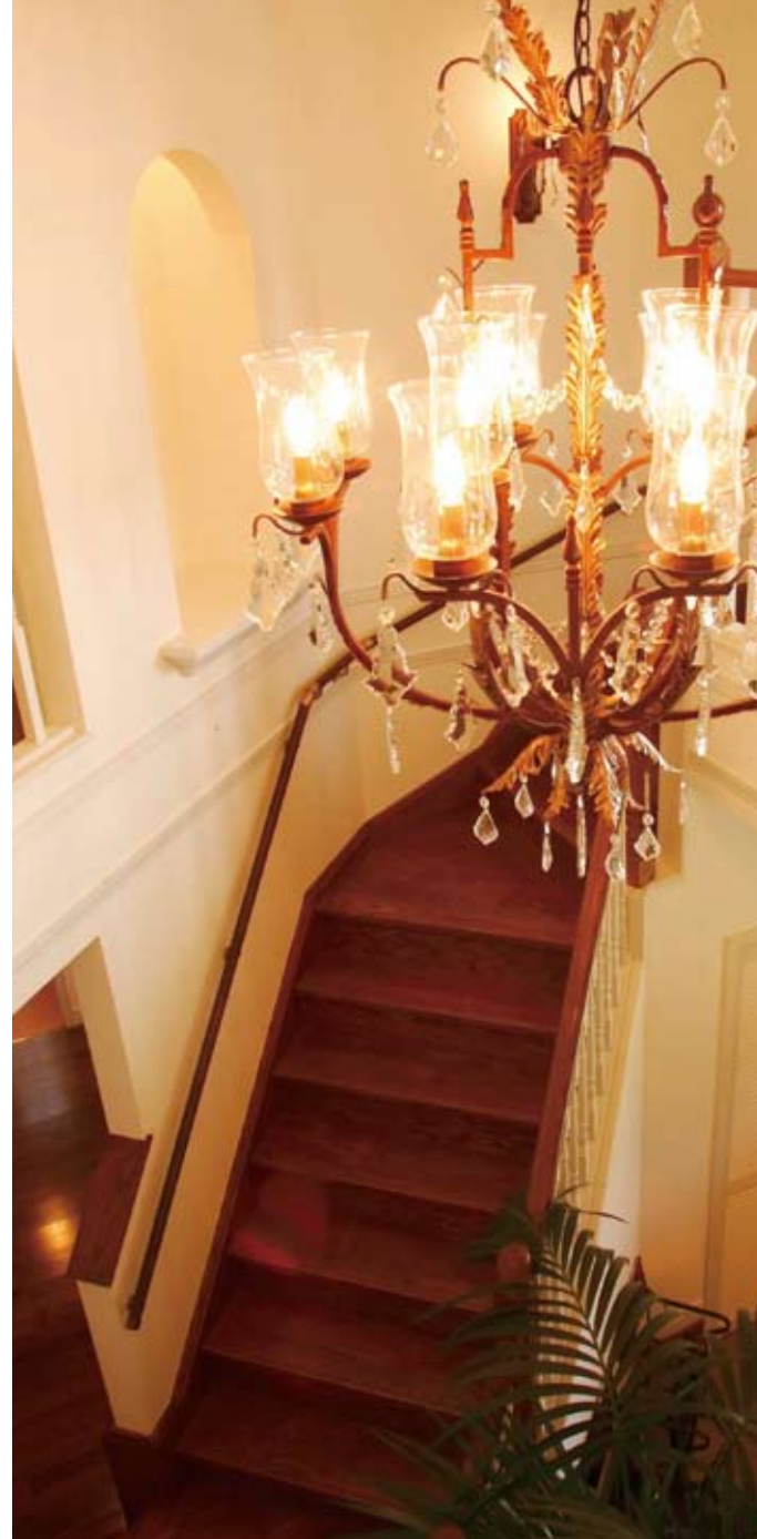
映画のワンシーンを見るような、優雅でゴージャスな廻り階段。ダークな色調の床に白い手すり、シャンデリアが美しく映える（施工例）