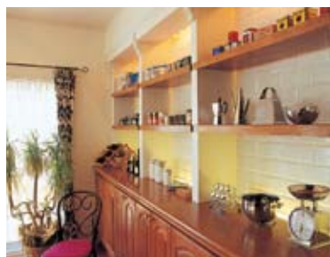
壁面にデザインされたディスプレイ棚。オークムク材とタイルの異なる素材の調和が美しい