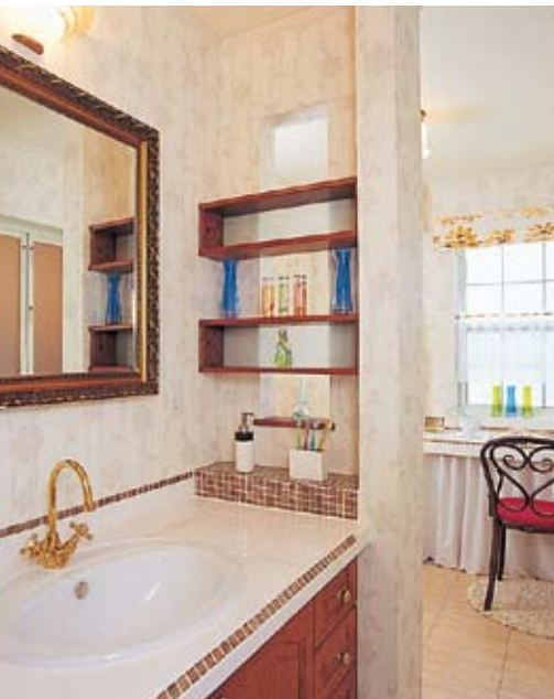
輸入洗面化粧台。モザイクタイルが小粋なアクセント。小物を置くラックを造作して機能的に