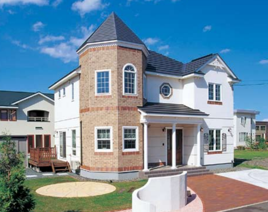
輸入レンガ貼りの八角形の尖塔がシンボリックな〈クイーン・アン〉外観。塗り壁やハーフサークルウィンドー、八角窓、ロートアイアの窓飾りなど伝統的な建築様式の気品が漂う