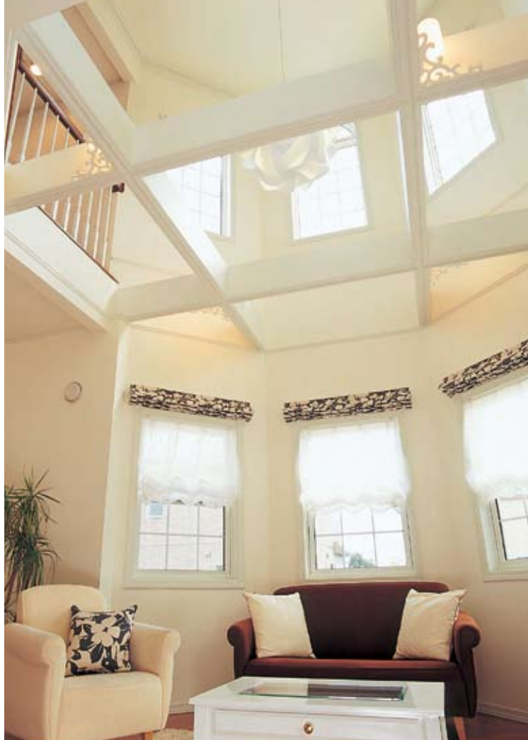
ダイナミックな吹き抜けのリビング。ここは、左の写真に見る外観の八角形の部分。白を基調とした繊細な美しさとモダンテイストにあふれる、デザイン性に富んだ空間設計が魅力的