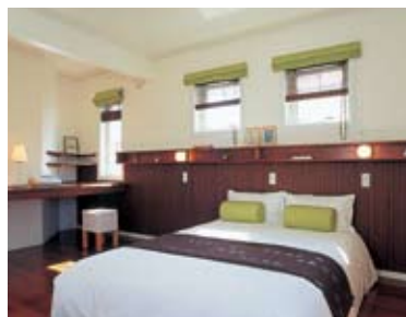
書斎コーナーのあるゆったりとした主寝室。腰パネルが落ち着いた雰囲気を印象づける