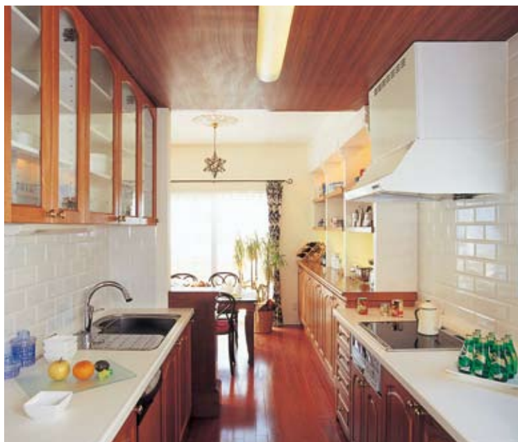
シンクとクッキングヒーターそれぞれの機能に合わせて配置された2列型のカナダ製システムキッチン。前面には大判の白い輸入タイルを採用し、壁面も無駄なく活用して収納量を確保している

〈クイーン・アン〉 ●延床面積／141.91㎡ (42.92坪) ●1階床面積／76.03㎡ (22.99坪) ●2階床面積／65.88㎡ (19.92坪)