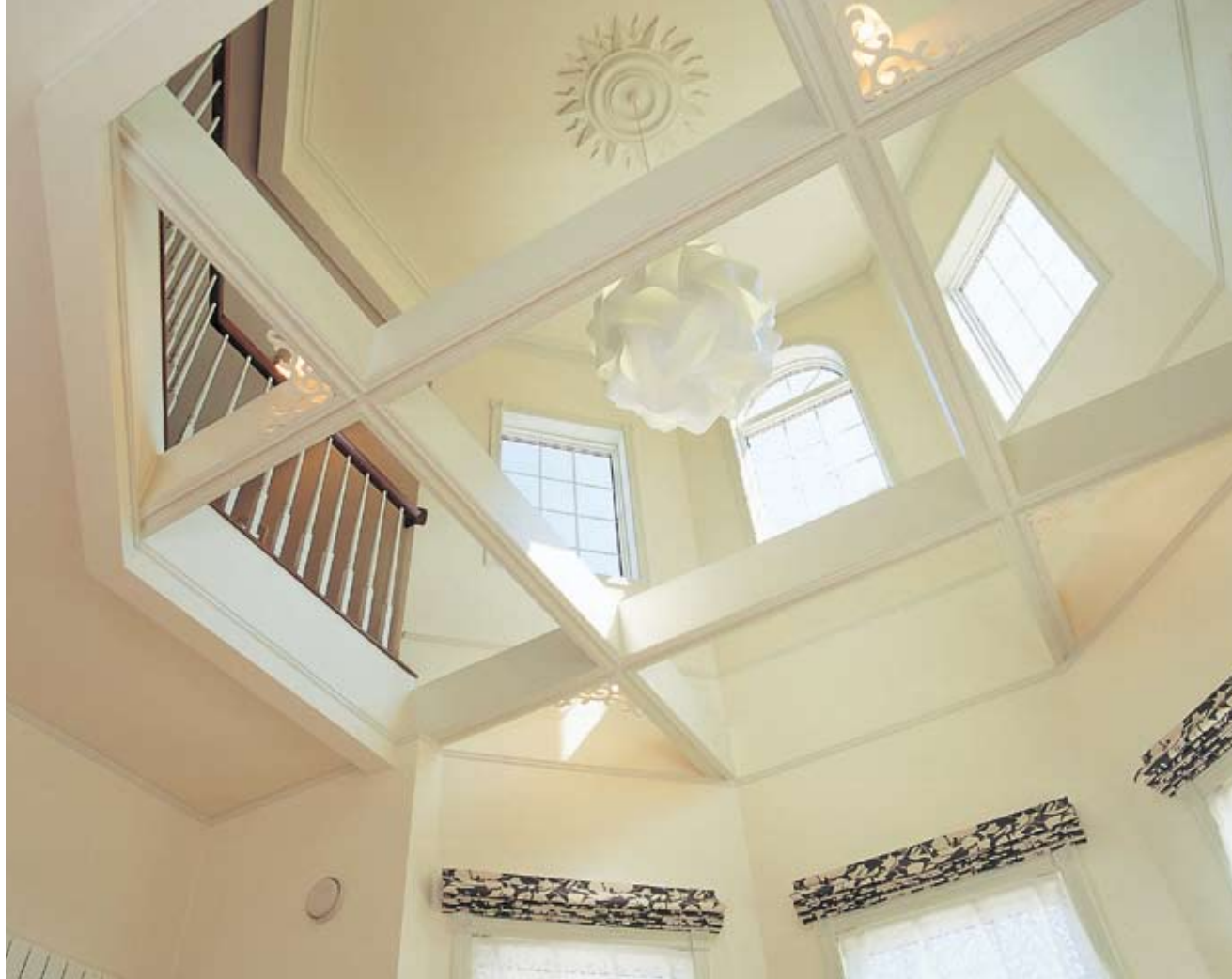
梁がクロスする意匠に富んだ吹き抜けの空間。シャンデリアを支える太陽のようなシーリングプレートや、梁のコーナーに添えた飾りはハンドメイドの輸入アイテム。伝統的なデザインをモチーフにしながら現代的なシルエットをもつ端正な空間を実現している（写真はいずれもセルコホーム帯広〈クイーン・アン〉モデルハウス）