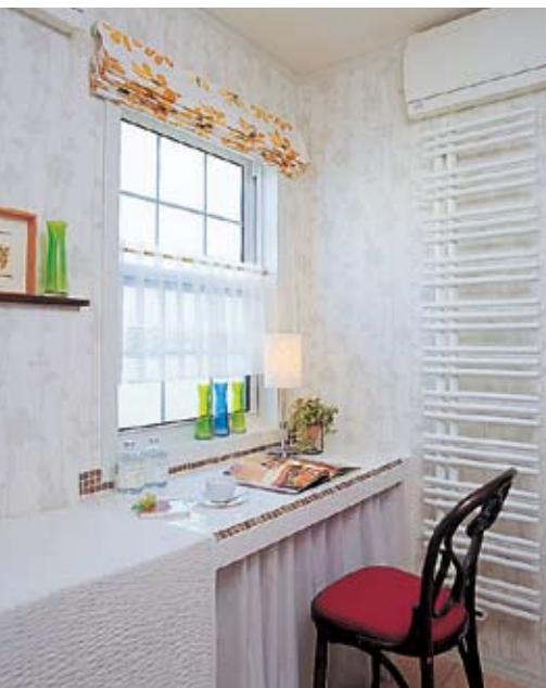
ユーティリティに設けられたタイル貼りの家事スペース。窓に面しているのでも明るい