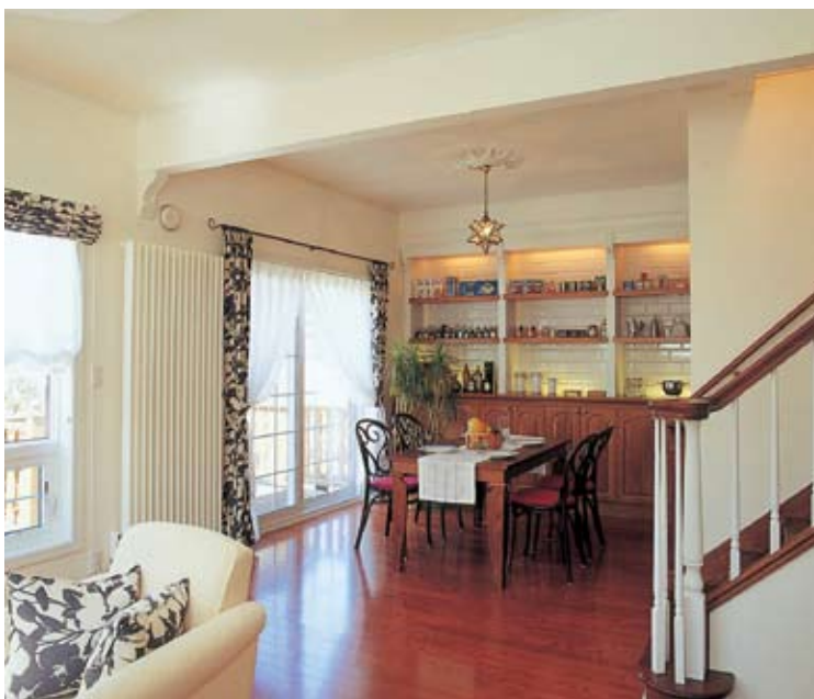
リビングと連続したダイニングは、明るさと木質感にあふれる空間。フローリングは堅くてキズがつきにくいカナダ製のアッシュ18mm。ムク材特有の表情豊かな質感と落ち着いた仕上がりが特徴