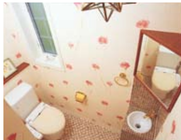
手洗いに輸入モザイクタイルを施すことで、おしゃれで楽しいイメージを演出したトイレ

■〈クイーン・アン〉モデルハウス 住所／帯広市稲田町東1線11-22 時間／10：00AM～5：00PM (定休日／火曜日・水曜日) 問合せ／0120-444-246